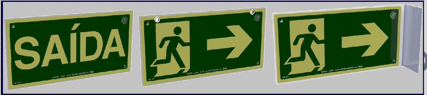
Tabla de medidas y distancia de señalización: